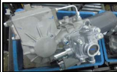
製品名:コンバイン用HST

RTV搭載用 HST 一体型ミッション、コンバイン・トラクター・田植機・建機用コントロールバルブ、トラクター・ユーティリティークール・田植機・コンバイン・モア用ギアポンプ、B・Mトラ用油圧シリンダー本体、油圧モーター、トランスミッション、トラクター搭載用パワステコントローラー他