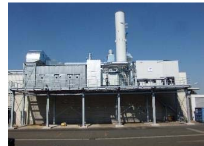
VOC emission reduction measure