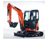
ZERO TAIL EXCAVATOR