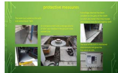
to 5. Wastewater treatment room and underground emergency ta