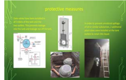
to 4. Sewer valves